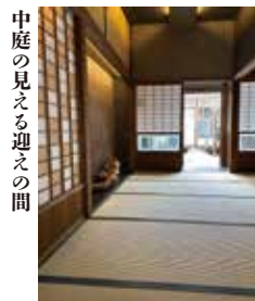
中庭の見える迎えの間

縁側に座って本を読むのもよし 中庭の中央に3畳のタイル敷は 寝転んで星を眺めるには最高！ 完全なプライベート空間なので 空の舟と名付け この時空間ありきの虚空の宿で 完全密室なので 心まで一条纏わず居られる。。