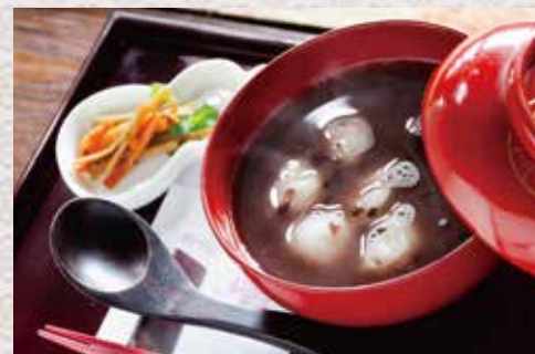
白玉団子ぜんざい