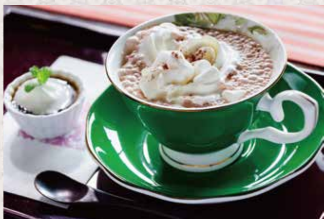
ホットチョコレートドリンク