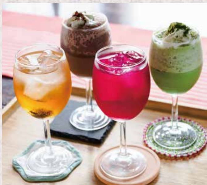
アイスチョコレートドリンク お抹茶ミルク 梅ジュース しそジュース