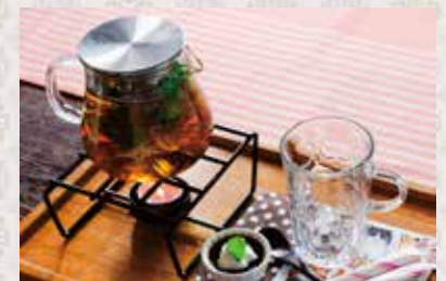
フレッシュミントティー