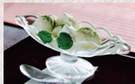
抹茶かけアイスクリーム