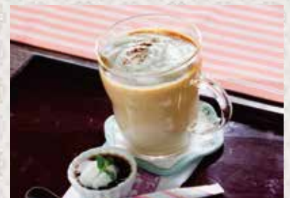
ホットミルクコーヒー